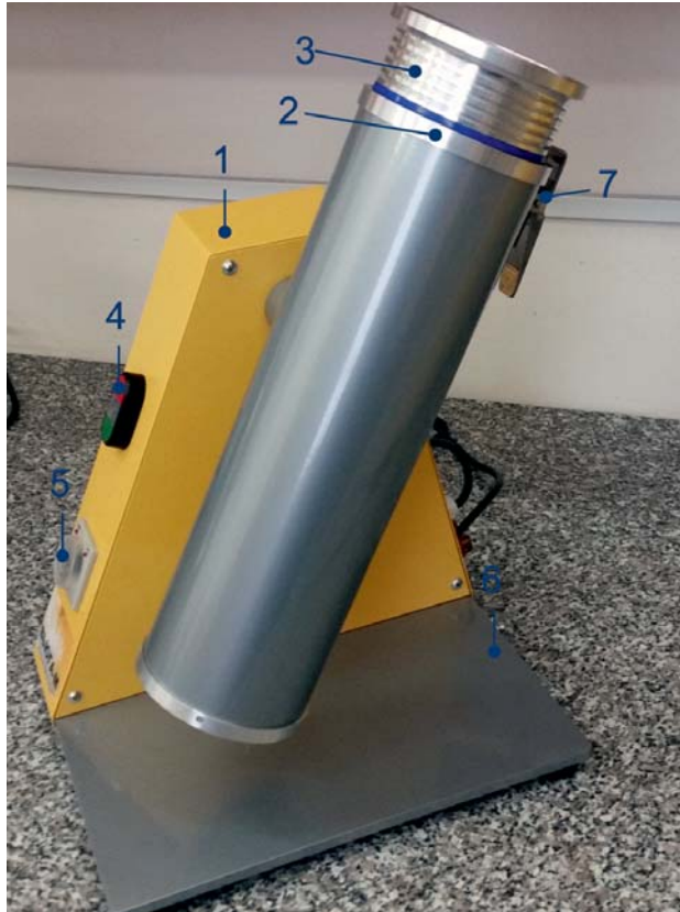
Рис. 1 Внешний вид лабораторной мельницы: