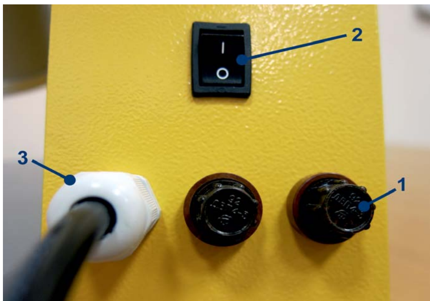
Рис. 2 Внешний вид лабораторной мельницы: